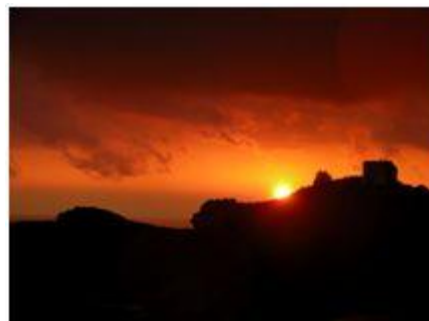
Coucher de soleil sur le domaine de Sainte Frétouze