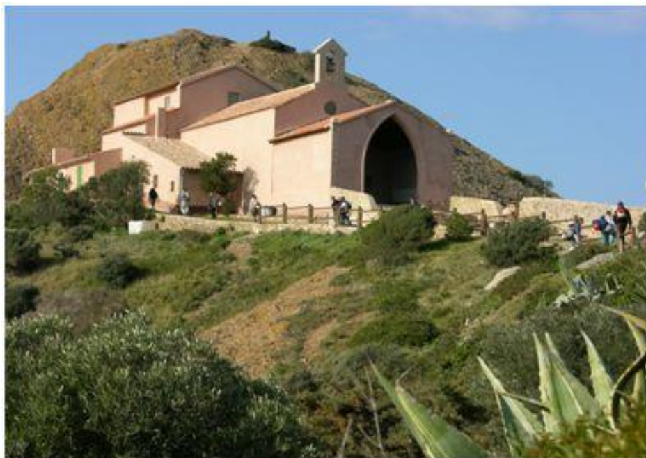
Un groupe de randonneurs accède à la chapelle de la Garde.

Itinéraire : Remonter le chemin de la Garde en direction de la cité dite la « Kasbah » que l'on dépasse.