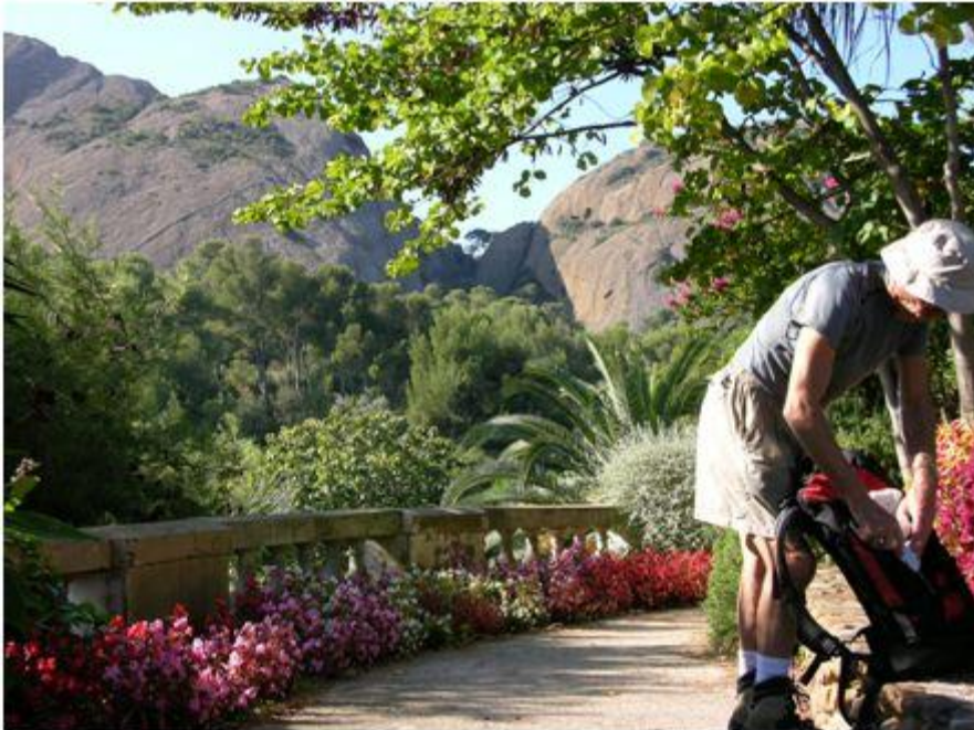
Préparation du sac à dos à l'entrée du Parc du Mugel. Point d'eau et toilettes publiques.

Curiosités : calanques du Mugel, parc municipal, belvédère, impluvium, anse du Sec et labyrinthe aquatique de Nègue-Froume.